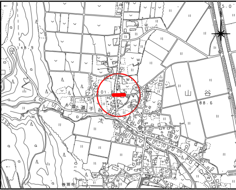
位置図 縮尺 1/10,000

試掘箇所(案) 本工事施工の前に、必ず試掘を行い 既存地下埋設物の位置を確認すること。 また、調査位置については立ち会い後 監督員と協議を行ない最終決定する。